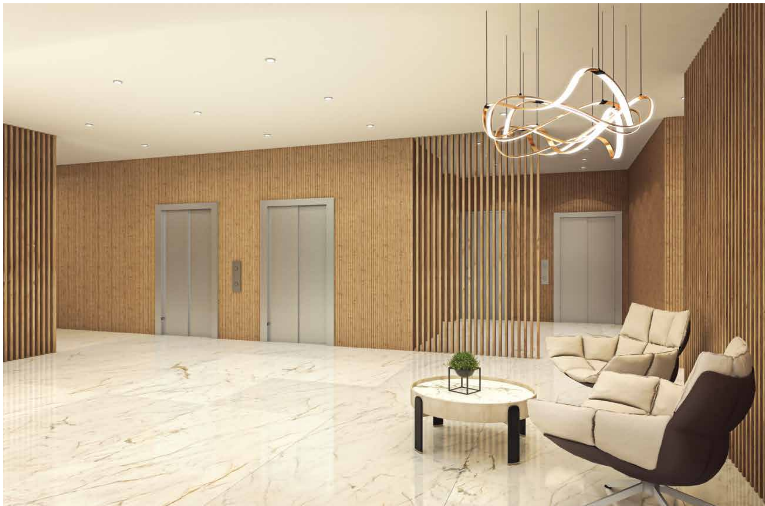
Átrio / Lobby