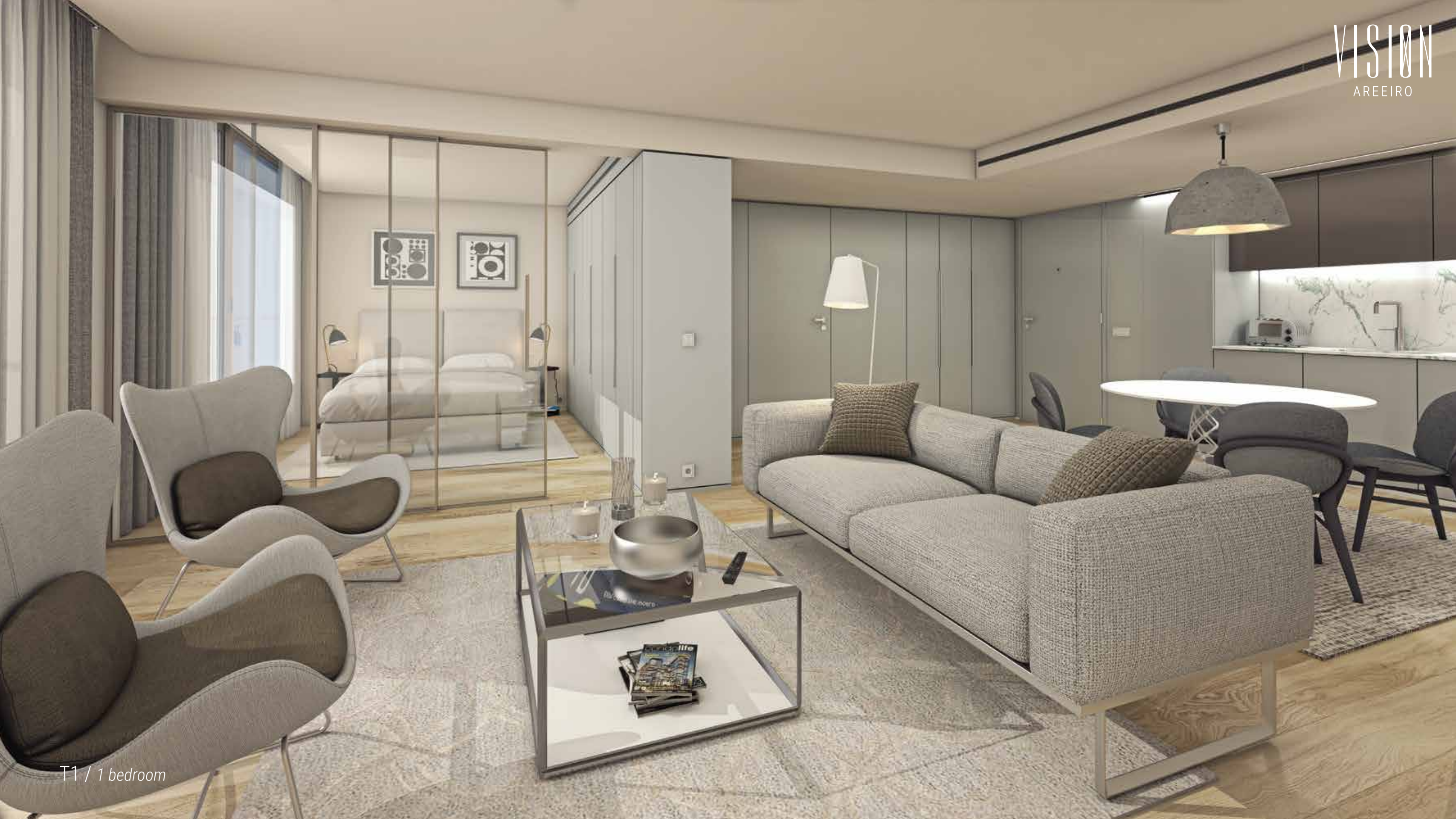
T1 / 1 bedroom