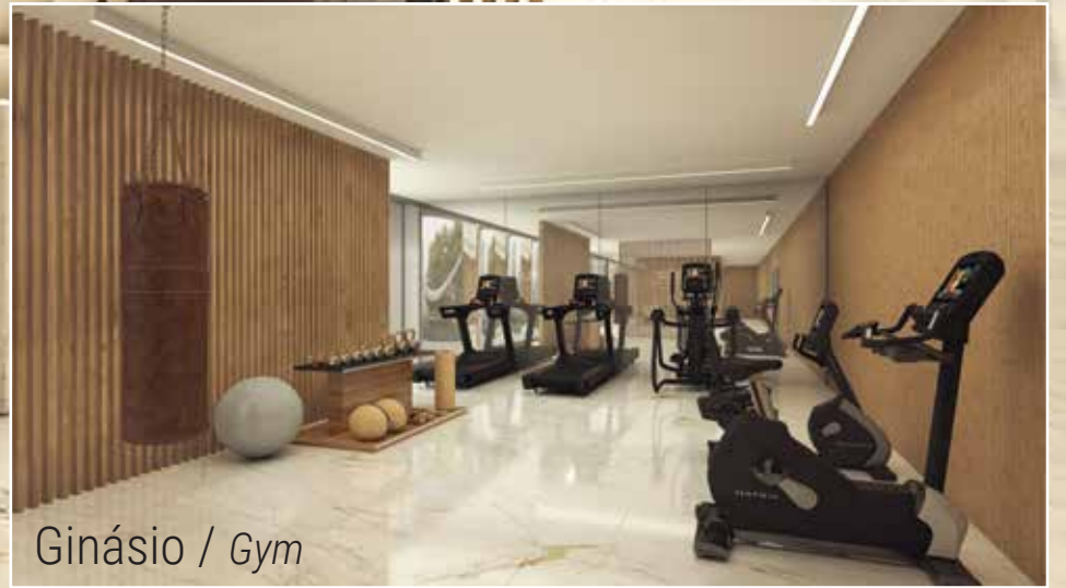
Ginásio / Gym