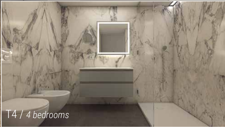
T4 / 4 bedrooms