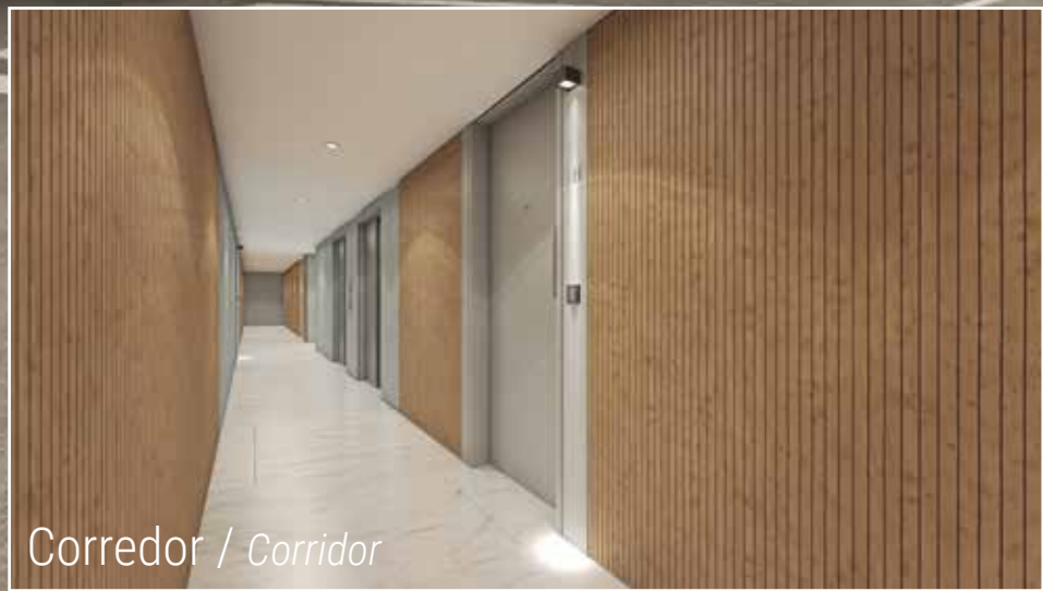
Corredor / Corridor