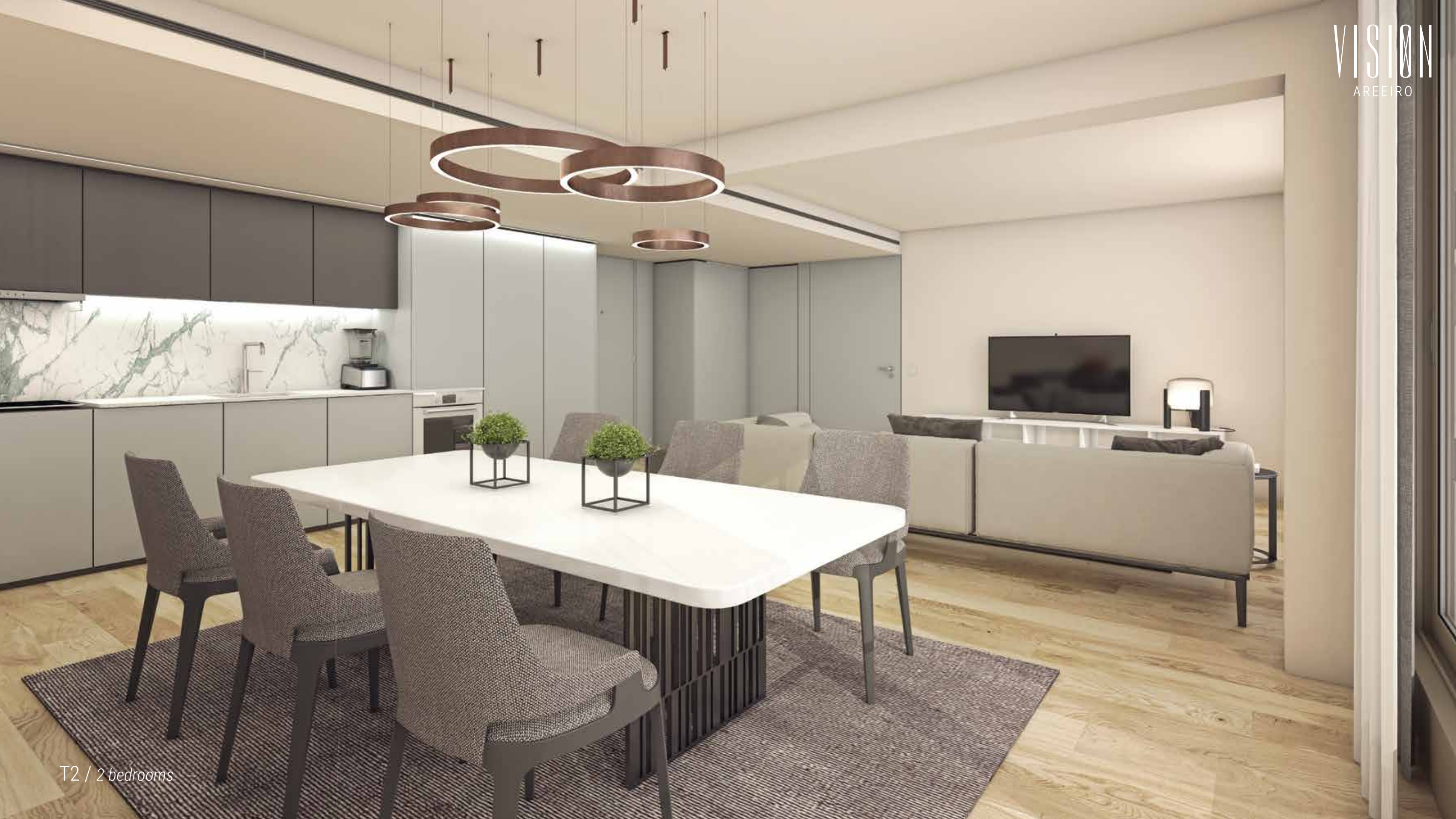
T2 / 2 bedrooms